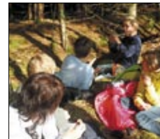
Auch viele Kinder waren dabei

schach zu unserem Wanderziel. Nach ca. 2 Stündiger leichter Wanderung erreichten wir den Wallfahrtsort Maria Waitschach der