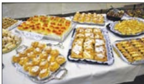
Die hervorragenden Mehlspeisen die unsere Mitgliederfrauen für uns machten.

In diesem Jahr wurde der Vortrag und die Hoppals auf einer noch größeren Leinwand den Mitgliedern nähergebracht. Mit über 300 Bildern - was rekordverdächtig scheint - wurden unseren anwesenden Mitgliedern die vielen Ak-