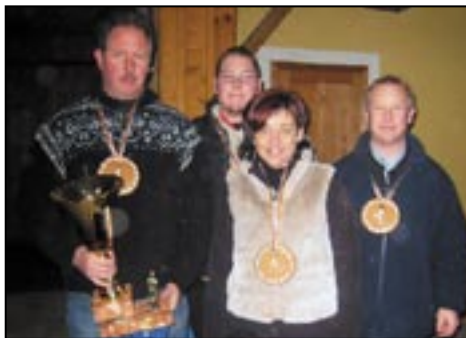
Sie müssen den Titel vom vergangenem Jahr verteidigen

Also, alle Mitglieder unserer Ortsgruppe, ob Frau oder Mann, ob Jung oder Alt, sind recht herzlich dazu eingeladen mitzutun. Auch bei der Zusammenlosung der Moarschaften wird sich nichts ändern. Das heißt, dass die Damen gesetzt und die Herren dazugelost werden. Natürlich gibt es wieder schöne Sachpreise zu gewinnen.