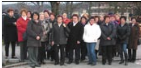
Die große Damenrunde machte ihren Jahresabschluss in Velden.

23 Damen, so viele waren schon lange nicht mehr bei der Damenrunde dabei, machten sich auf den Weg nach Velden. Aufgrund der hohen