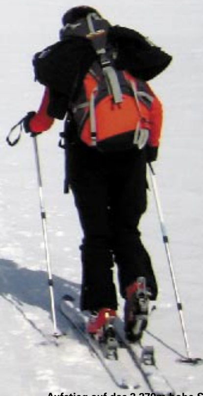
Aufstieg auf das 2.279m hohe Schiesseck

Ein 3. und 4. Platz wurde bei der Naturfreunde Landesmeisterschaften im Eisstockschießen erreicht!