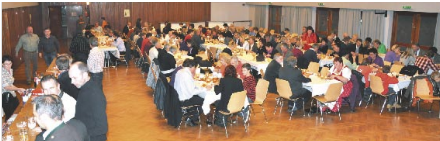
Der gut sehr gut besuchte Saal des Gemeinschaftshauses in Brückl

Schon zum zweiten Mal führten wir unseren Jahresrückblick im Gemeinschaftshaus in Brückl durch.