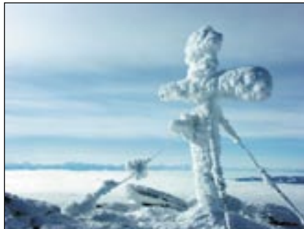
Der Speikkogel auf der Koralpe

Wenn die Schneesverhältnisse es zulassen werden wir die Koralpe auf zwei verschiedenen Routen begehen. Die eine Route die für Anfänger gedacht ist führt uns entlang der Skipiste zum Koralpenhaus und weiter zum Gipfel der Koralpe dem 2.140m hohen Speikkogel. Die zweite Variante führt