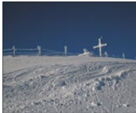
Kurz vor dem Gipfel des Stubeck's

-Rücken - ohne Orientierungsprobleme - bis zum Gipfel des Stubecks (2370m). Die letzten Meter zum Gipfel sind oft abgeweht - bei genügend Schnee aber kein Problem. Eine ideale Einstiegstour!