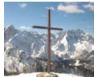
Das Gipfelkreuz oberhalb von der Kirche von Lussari