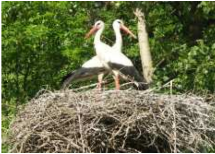
gemma Störche schauen