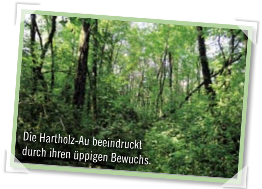
Die Hartholz-Au beeindruckt durch ihren üppigen Bewuchs.