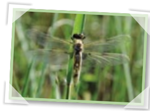
Eine frisch geschlüpfte Libelle.

Eine Libelle verbringt die meiste Zeit ihres Lebens als Larve und lebt nur kurz als flugfähiges Insekt. Libellenlarven sind Räuber, die andere im Wasser lebende Insektenlarven, kleine Krebse oder auch Kaulquappen fressen. Zum Fangen ihrer Beute besitzen sie eine spezielle Fangmaske. Diese ist im Ruhezustand unter dem Kopf gefaltet und kann blitzschnell hervorschnellen, wenn ein Beutetier in die Nähe der Larve kommt.