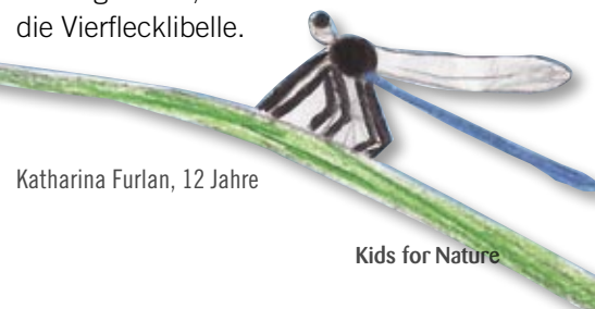
Katharina Furlan, 12 Jahre

Einige für den Auwald an der Bregenzerach-Mündung typische Libellenarten sind der Große Blaupfeil, die Glänzende Smaragdlibelle, die Plattbauchlibelle und die Vierflecklibelle.