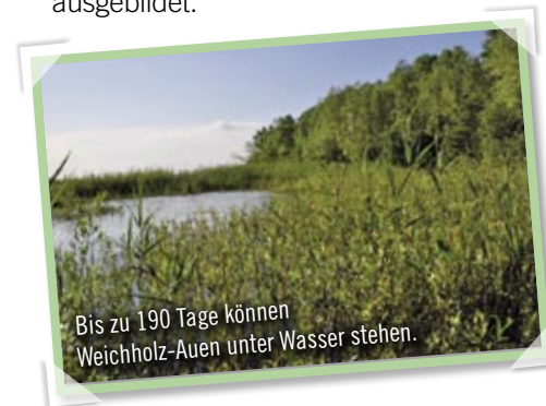
Bis zu 190 Tage können Weichholz-Auen unter Wasser stehen.

Auf den etwas weniger lange überfluteten Standorten sind Silberweiden-Auwälder ausgebildet.