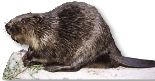
Biber ernähren sich ausschließlich von pflanzlicher Kost, wie Wasser- und Uferpflanzen sowie Knospen und junger Rinde von Bäumen und Sträuchern.

Der Biber ist das größte Nagetier Europas und ein typischer Bewohner unserer Auen. Durch das Fällen von Bäumen und den Bau von Dämmen gestaltet er die Flusslandschaft. Er ist perfekt an das Leben im Wasser angepasst: Sein breiter, unbehaarter Schwanz dient beim Schwimmen als Steuer, Ohren und Nase sind beim Tauchen verschließbar und die Augen werden unter Wasser durch ein hauchdünnes Häutchen geschützt.