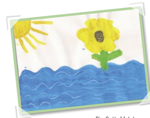
Pia Gatt, 11 Jahre

Der Mündungsbereich wird stark durch den schwankenden Wasserstand des