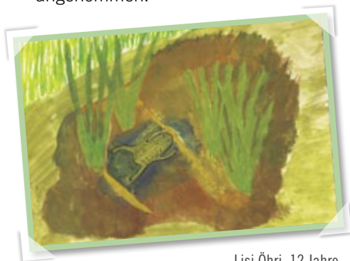
Lisi Öhri, 12 Jahre

Die Tiere werden 4 bis 5 cm groß und lieben es warm. Den Frühsommer verbringen sie im und am Gewässer. Dabei werden kleine, flache, unbeschattete Tümpel, die sich rasch erwärmen, bevorzugt. Die Eier werden in Klumpen abgelegt, aus denen sich dann Kaulquappen entwickeln. Je wärmer das Wasser, desto schneller ist die Entwicklung von der Kaulquappe zum Jungtier. Dann wandern die Tiere in nahe gelegene lichte Wälder, Feuchtwiesen oder offene Flächen. Auf ihrem Speisezettel stehen Wasserinsekten, Nacktschnecken und Würmer.