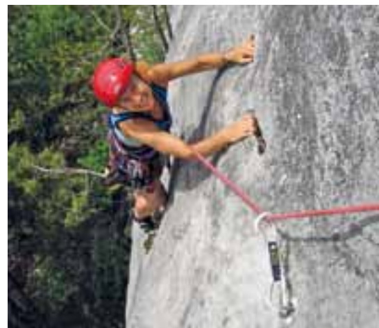
In der 1. Seillänge von „Steinbockalarm“

Diese tolle, sehr beliebte und relativ lange Genusskletter-Route des genialen Duos Peter Königsberger und Alfred Riedl weist auch einige leichte Passagen und kurzes Gehgelände auf. Sie führt durch henkeligen Fels mit nahezu plaisirmäßiger Absicherung (größtenteils Klebehaken). Fast alle schwierigen Stellen