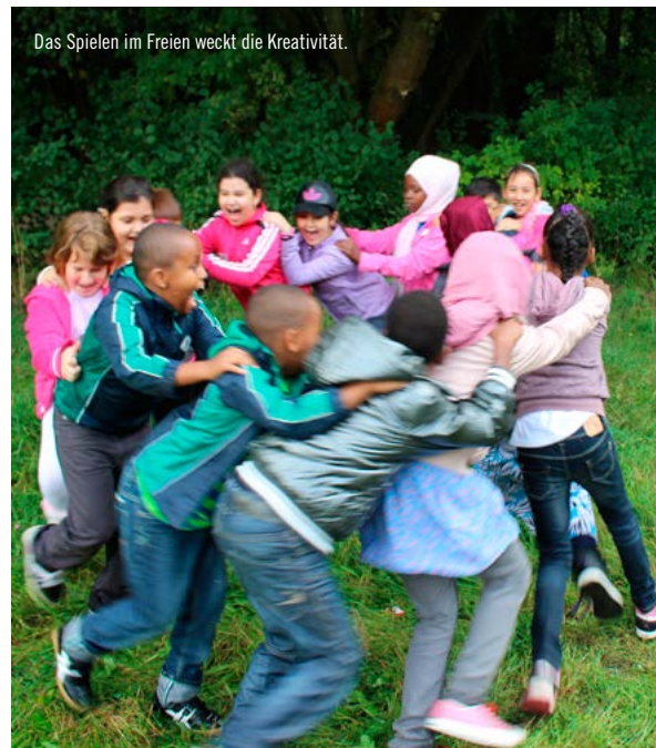
Das Spielen im Freien weckt die Kreativität.

Auch in der Schule ist es wichtig, die Natur einzubeziehen. Maßnahmen zur naturnahen Gestaltung des