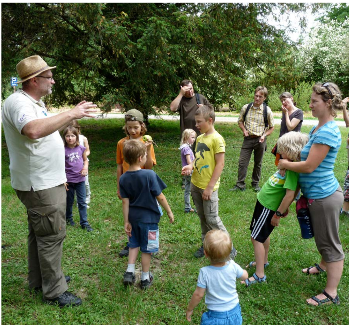
Gemeinsames Naturerleben fördert den sozialen Austausch.

Natur wird auch als Therapie-Ressource eingesetzt, um soziale Fähigkeiten zu stärken. In Wildnistherapien („nature assisted therapies“) erwerben Personen mit unterschiedlichen Verhaltensstörungen soziale Kompetenzen wie Kooperationsbereitschaft und Engagement 39 . Diese Therapieaufenthalte bauen zwar vorrangig auf psychologischen Praktiken auf, eine wesentliche Komponente der Behandlung ist aber immer der intensive Kontakt mit der Natur, der die Therapie unterstützt.