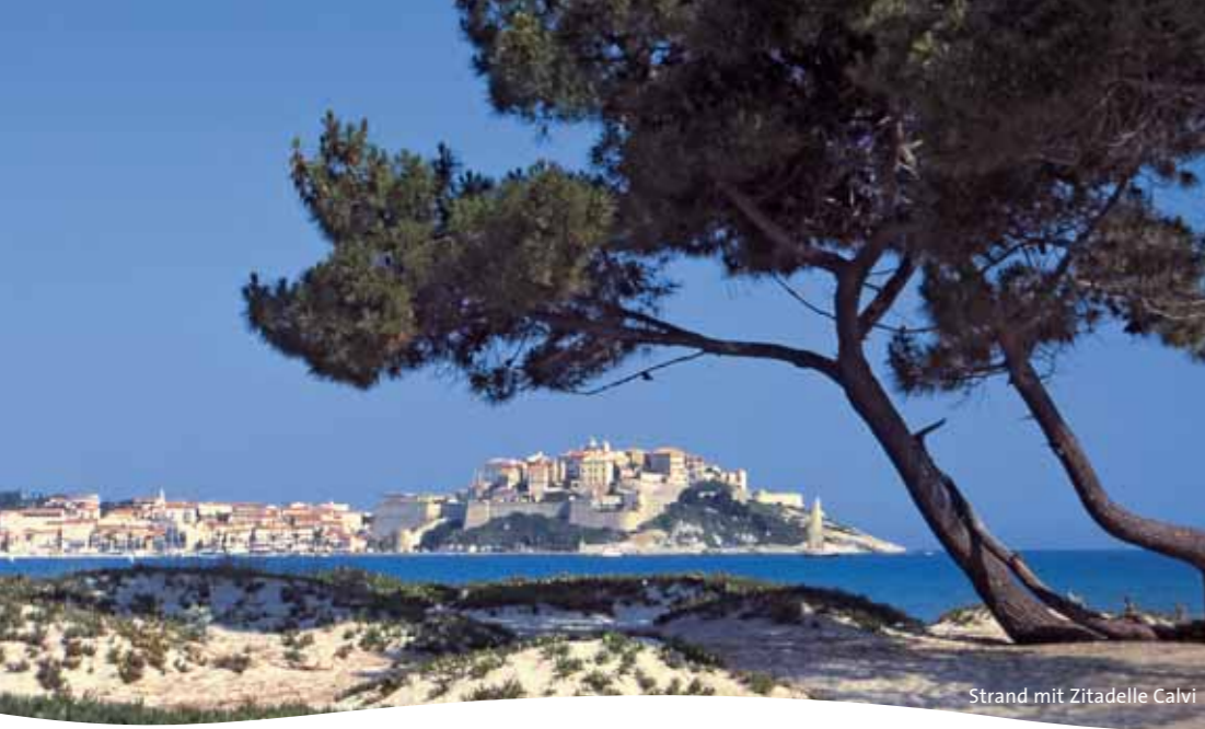
Strand mit Zitadelle Calvi