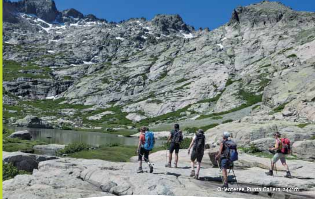
Orientesee, Punta Gallera, 2441m