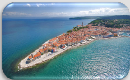
Foto Portoroz / Piran

Wer diesen Schatz in der Adria jemals aus der Vogelperspektive gesehen hat, also in seiner Gesamtheit, der braucht keine Worte mehr, um das Besondere, das Außergewöhnliche zu beschreiben! Das "Seebad von Weltruf" wie es in der k & k - Monarchie hieß, Portoroz oder Portorose, liegt in einer wunderschönen, windgeschützten Bucht. Umgeben von einer der ältesten Salinen Europas auf der einen Seite und von den typischen Istrischen Hügeln mit ihren Olivenhainen auf der anderen Seite.