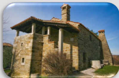
Hinterland von Piran