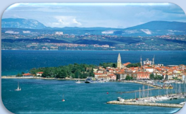
Blick auf Izola