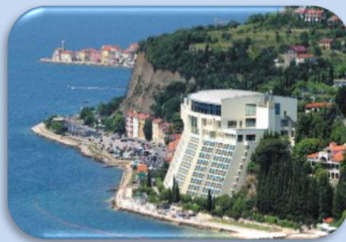
5 Sterne Grand Hotel Bernardin