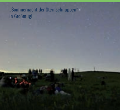
„Sommernacht der Sternschnuppen“ in Großmugl

In Österreich ist Großmugl im Weinviertel die erste Dark Sky Area – und nennt sich jetzt Großmugl an der Milchstraße.