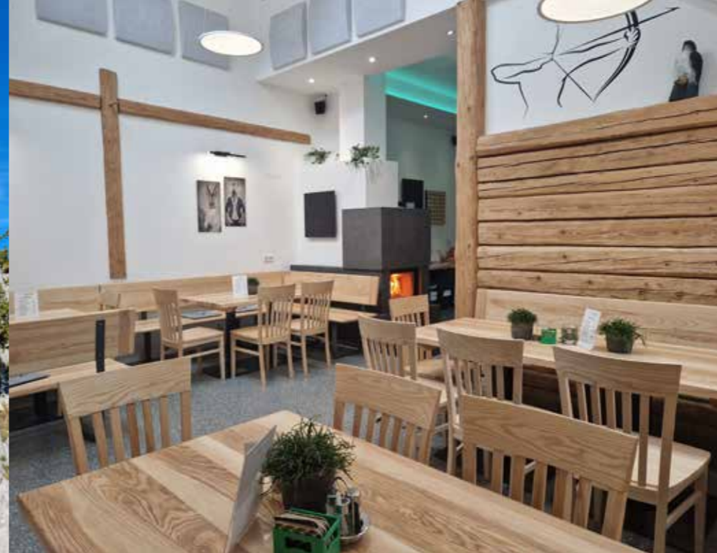
← Das neue Bogensport Vereinslokal