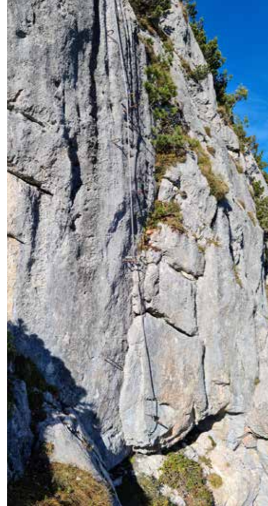
↑ Der sanierte Klettersteig am Übungsfelsen

Der Feuerraum wurde erneuert. Der Ofen liefert nun wieder Wärme und weil er mit Wassertaschen ausgestattet ist, werden auch die Heizkörper des Hauses damit beheizt.