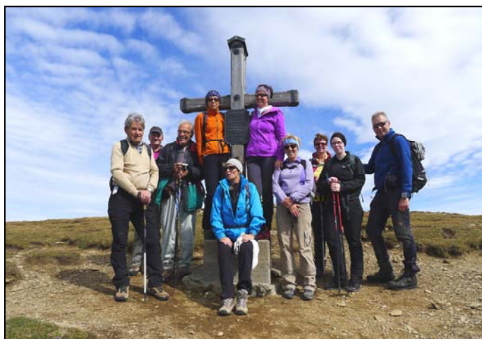
Hochpalfenock - Millstätter Alpe