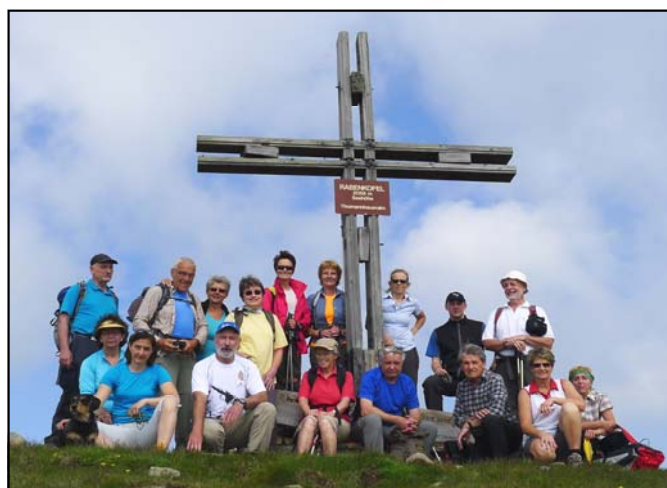
Raberkofel - Drei-Gipfel-Wanderung