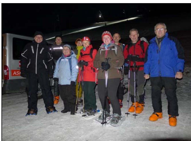
Vollmondwanderung - Bad Kleinkirchheim